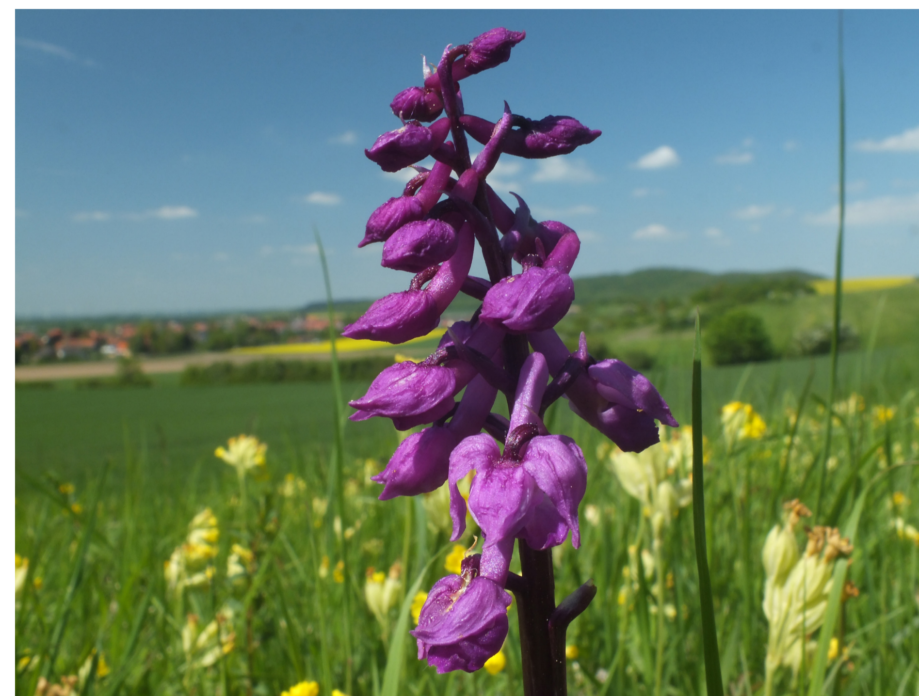
Stattliches Knabenkraut, eine Orchideen-Art