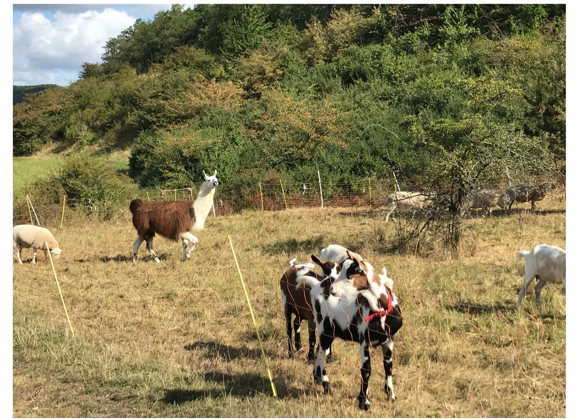
Ziegen, Schafe und ein Lama

Die Pflanzengesellschaft der Kalk-Halbtrockenrasen ist als Teil einer historischen Kulturlandschaft durch den landwirtschaftlenden Menschen seit dem Mittelalter entstanden. Weidetiere, wie Schafe, Rinder